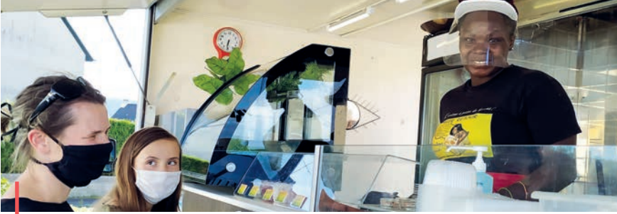
Photo prise le vendredi 4 septembre, lors de la reprise du marché