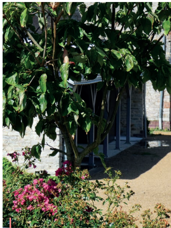
Parvis de l'Agora